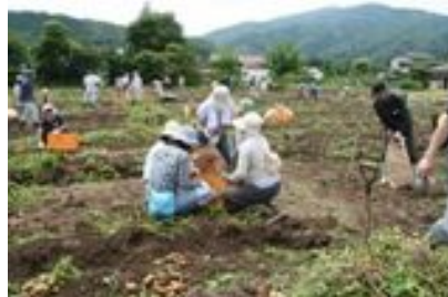
昨年の皆野下田野地区様子

遊休農地等を活用し農家の指導のもとで、ジャガイモ栽培体験を通じ食や農業について考えます。