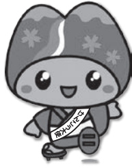
皆野町けんこう大使 み～な