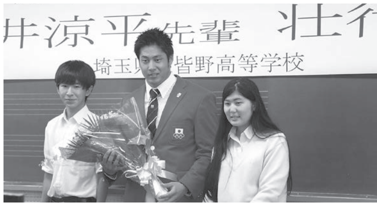
がんばれ 新井先輩 皆野高校 新井 涼平選手 リオ五輪 壮行会

7月17日(日)県立皆野高等学校において、陸上競技やり投げでリオ・デ・ジャネイロオリンピックへ出場が決定した、新井涼平選手を迎えて、母校の皆野高校が壮行会を開催しました。生徒・保護者など約80人が参加し、五輪での活躍を期待し激励しました。