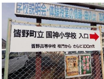
【皆野高校入口付近】

本校に初めてお越しいただく方々から、「本校の入口が分かりにくい」というお声や、近くを通った方から、「どこに学校があるか分からなかった」というお声を耳にすることがありました。