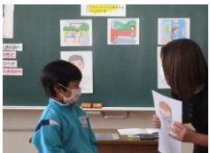
1年生：プライベートゾーン

学年末の授業時間を使って、子どもたちと一緒に「命」や「体」について学習しました。