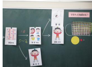
4・6年生：コロナについて