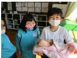
2年生：大切ないのち