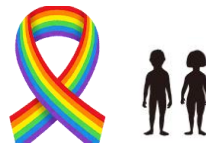
5・6年生：性的少数者への配慮