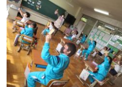
3年生：命のつながり