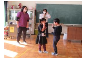
平均台のかわりに、線の上で蛇ジャンケン