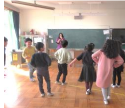
目を閉じて片足立ち

理科室の骨格模型と先生の体を使って、正しい姿勢のポイントとからだの仕組みをていねいに教えていただきました。