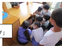
3校合同ロング集会「オリエンテーリング」

早いもので、1学期も締めくくりの時期を迎えました。各学年では、学習や生活のまとめに取り組んでいます。1学期を振り返り、自分の成長を確かめると共に、今後の課題を見つめ直すことは、次の学びへとつながる大切な機会です。子供たちが達成感をもって夏休みを迎えられるよう、教職員一同、一人一人を支えてまいります。