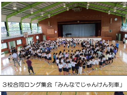
3校合同ロング集会「みんなでじゃんけん列車」