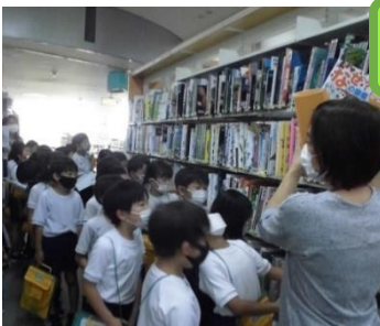
2年 生活科見学 10/8 秩父まつり会館・市立図書館