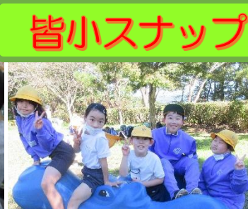
3年 遠足 10/20 秩父ミュージックパーク