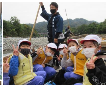
5年 体験学習 10/22 荒川ライン下り、焼き板、カレーづくり キャンドルファイヤー、校内ナイトウォーク