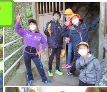
4年 遠足 10/21 浦山ダム・橋立鍾乳洞