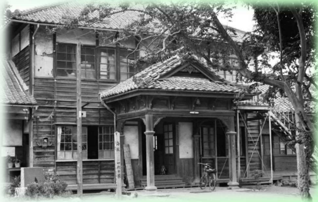
明治23年(1890年)建てられた木造校舎玄関

皆野小学校は、1873年(明治6年)に、皆野村と下田野村が連合し、円明寺に設立され、2023年(令和5年)に創立150周年を迎えました。