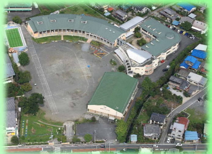
現在の校舎を上空から撮影