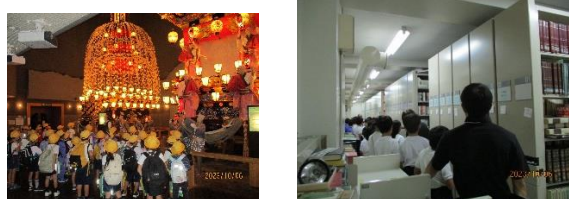
秩父市立図書館方面