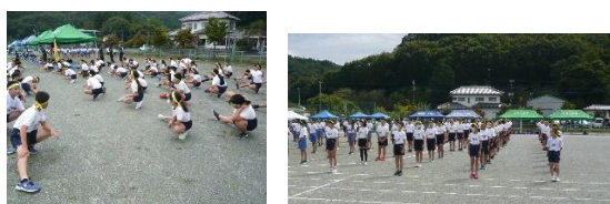
皆野スポーツ公園