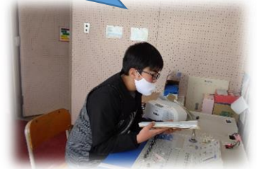
健康委員会が毎日放送で呼びかけています