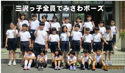
三沢っ子全員でみさわポーズ

今年は季節が2週間くらい早いと言われていますが、寒暖の差も特徴で、体調を整えるのにも気を遣う毎日です。そんな新学期もあっという間に1ヶ月が過ぎました。新たな学年での学びを生き生きと進める上級生に加え、3名の1年生も毎日元気に登校して、新たな「小学校生活」という学びを進めています。