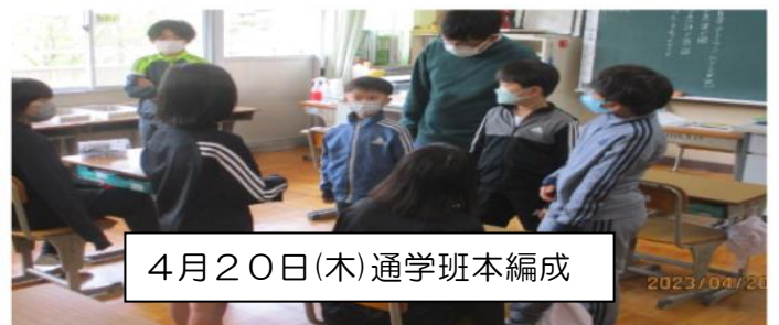
4月20日(木)通学班本編成