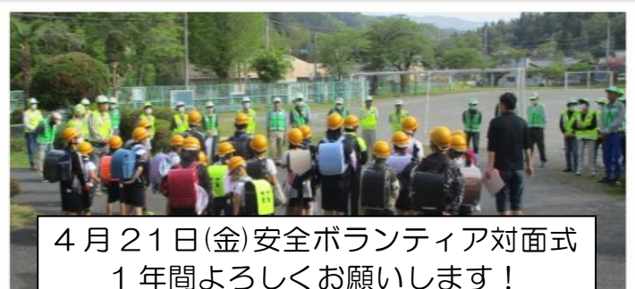
4月21日(金)安全ボランティア対面式 1年間よろしくお願いします!