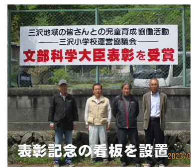
表彰記念の看板を設置 2023/0

こんなことが自然にできるのも 「三沢の風土」 があると思います。教育活動をご支援いただいている、学校運営協議会、PTA・後援会をはじめとする地域の皆様の活動や、安全ボランティアの皆さんの見守りなど、デジタルの時代の中に於いても、 相対しての「ふれあい」によって子供たちに望ましい人間関係を構築する能力が備わって行く と思います。今年も三沢のよい風土の中で「望ましい人間関係」を築きながら、充実した教育活動を進めて参ります。