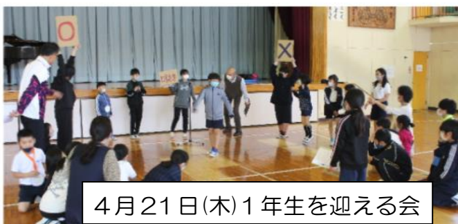
4月21日(木)1年生を迎える会