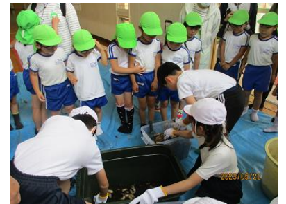
ABCプロジェクト (皆野幼稚園との交流)

「 宝の笑顔三沢っ子 」と決まりました。職員、子供たち一丸となって、目指す学校像の一つである「 さわやかな笑顔あふれる三沢小 」を目指していきます。