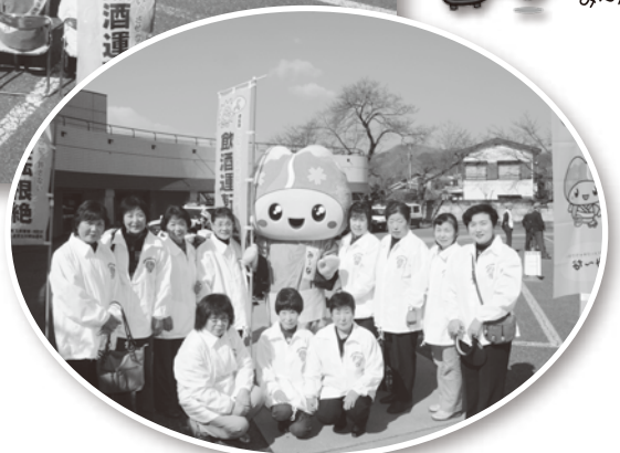
皆野町交通安全母の会

運転手の皆さん、子どもや高齢者を見かけたら、スピードを緩めるなど優しい運転を心がけましょう！