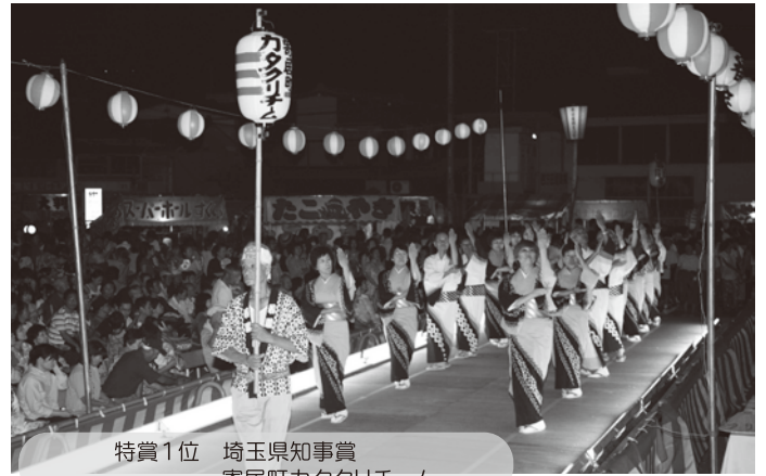
特賞1位 埼玉県知事賞 寄居町カタクリチーム