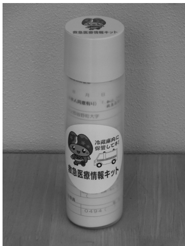
救急医療情報キット

原則として1軒に1セット ※配付を希望する方は、担当地区の民生委員 または健康福祉課にお問い合わせください。