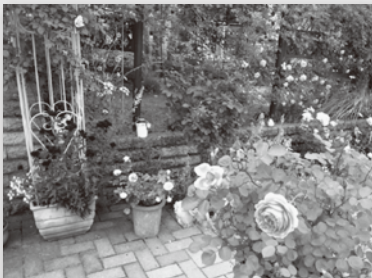
宮前さん宅 住所 大淵220-3

各ガーデンがバラをはじめ見頃を迎えています。役場や各ガーデンにパンフレットを設置していますので、ぜひご来園下さい。