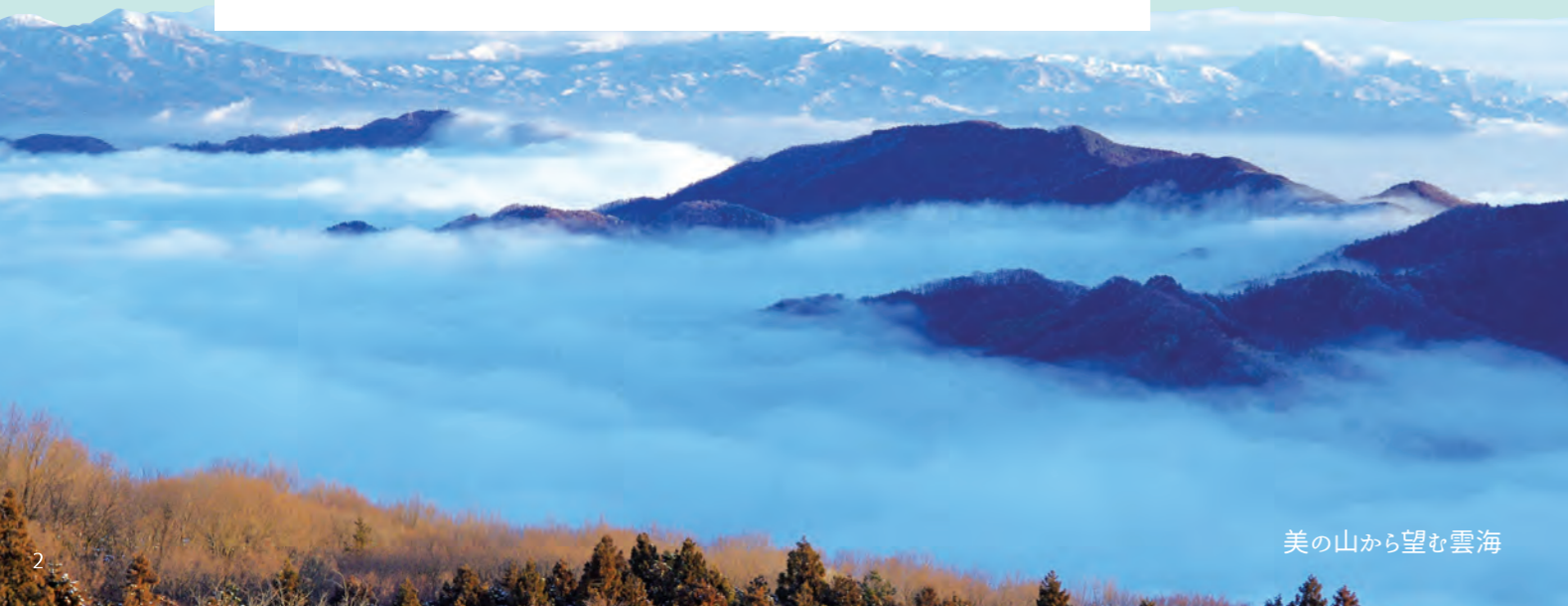
美の山から望む雲海