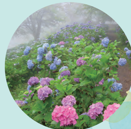
美の山のアジサイ