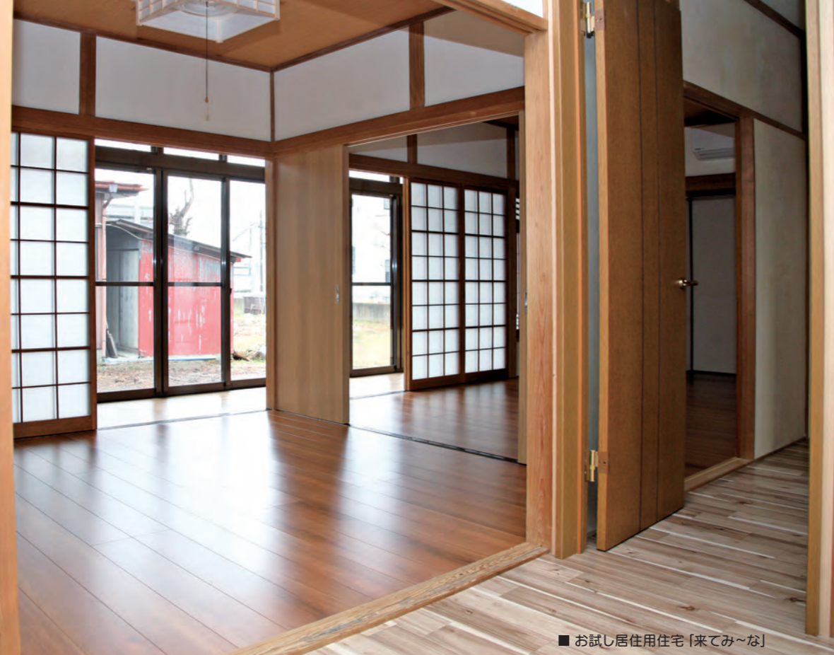
■ お試し居住用住宅「来てみ～な」