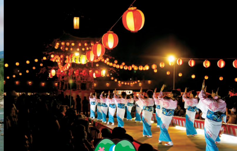
秩父音頭まつり (毎年8月14日開催)