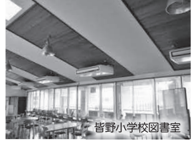
皆野小学校図書室