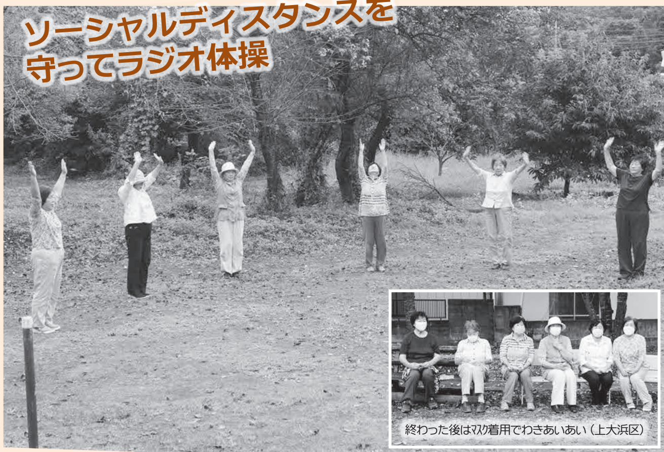
終わった後は双着でわきあいあい（上大浜区）