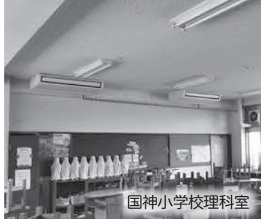
国神小学校理科室