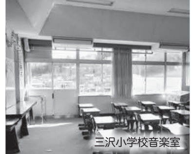
三沢小学校音楽室