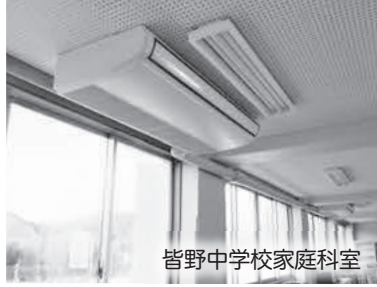
皆野中学校家庭科室