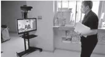
避難所を増やし、3密回避、避難上の注意、体温測定による判別等を推進しています。

A 37.5度以上の方を判別して警告音がなります(録画機能付)。最大1画面20人まで測定可能です。