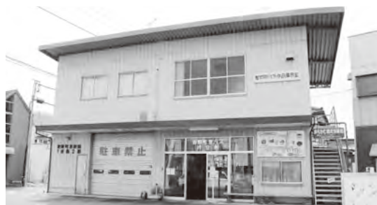
皆野町の新たな玄関に改修(町営バス発着所)

答弁 ATMの設置と店舗の拡張、さらにインフォメーションセンターの改修が行われます。