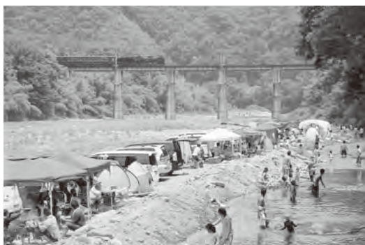
にぎわう親鼻河原

答弁 インターネットや、浅草の方で情報発信をしていきます。浅草を中心に大勢の方に皆野町を知ってもらい、遊びに来てもらうように考えていきます。また、春から秋にかけて楽しめるようにしたいと思います。