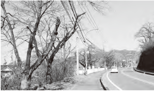
枯れ枝が目立つ現場 道の駅みなの 信号機手前(秩父方面)