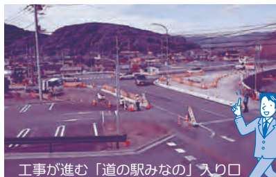
工事が進む「道の駅みななの」入り口

また、道の駅みななの入口交差点改修工事関連の質問があり、後日質問概要（秩父県土整備事務所からの回答）を受け「天候不良のため工期を延長、10月中旬に完成」を確認しました。