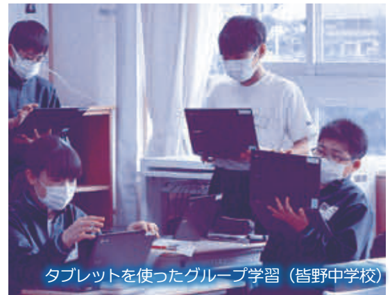
タブレットを使ったグループ学習(皆野中学校)