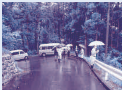
林道二本木線災害復旧工事