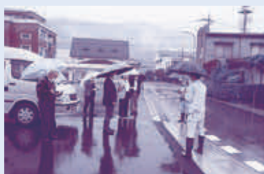
町道皆野160号線道路改良工事 (狭あい道路の拡幅)

今後も、現場の状況に合わせた工法、また景観に配慮した計画で、安心安全な町づくりを進めていってほしいと思います。