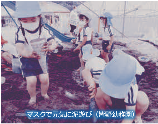
マスクで元気に泥遊び(皆野幼稚園)

答弁 子育て応援給付金は0〜15歳までは児童手当の口座に振り込み、公務員と高校生のいる世帯には案内通知を出します。時期は8月〜9月頃を予定しており、対象人数は1279名です。ひとり親家庭については、商工会と調整をして商品券を9月頃郵送します。対象人数は保護者とも209