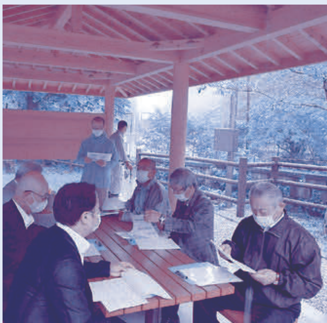
日野沢川親水広場のあずまやにて

産業観光課・建設課・教育委員会の所管する工事・事業の主な14件の現地を視察しました。