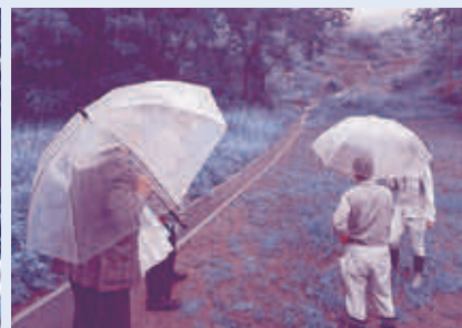
山村生活安全対策事業「治山工事」