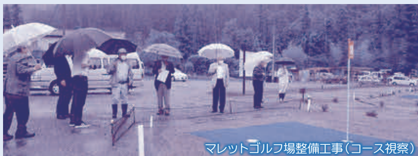
マレットゴルフ場整備工事(コース視察)