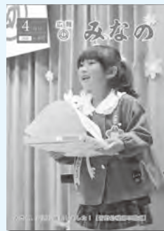
新年度予算で、国神小・三沢小はウォシ