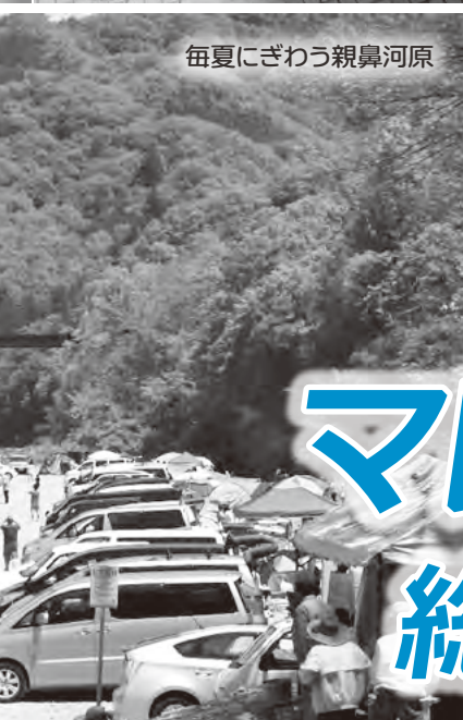
毎夏にぎわう親鼻河原