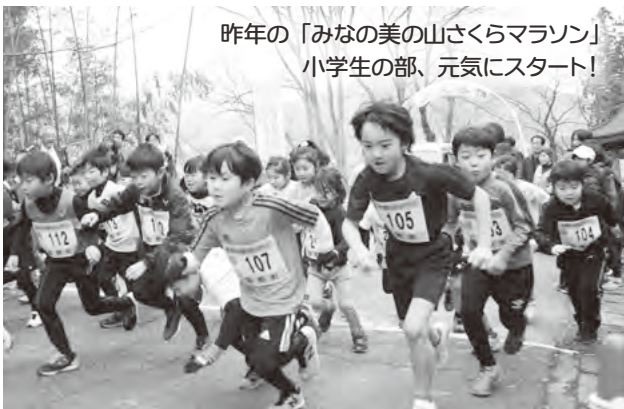
昨年の「みなみの美の山さくらマラソン」 小学生の部、元気にスタート!

答弁 みなみの美の山さくらマラソン大会は、町民の健康増進、体力向上、町の観光と宣伝や地域経済への波及効果もあわせて、町の活性化に資することを目的としています。