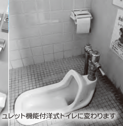
ユレット機能付洋式トイレに変わります