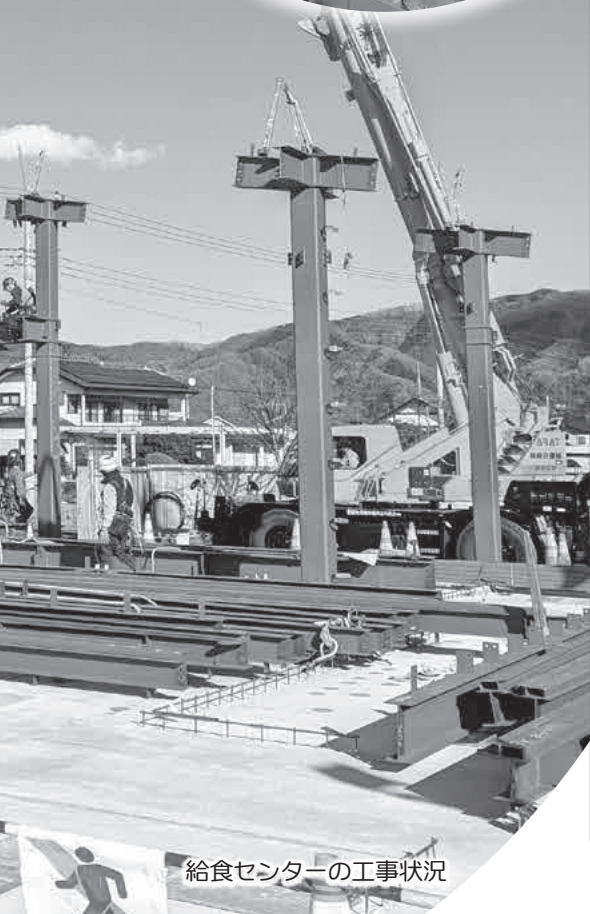
給食センターの工事状況