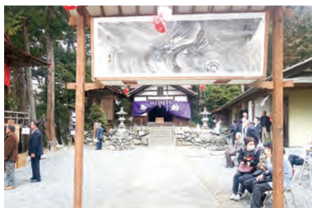
赤城大神社境内の大行灯

昨年は雨や雪が降り、行灯絵を全て失ったため教育委員会を通じて町内の幼稚園、各小・中学校に行灯絵の制作を依頼し、約600枚の行灯絵をいただきました。感謝申し上げます。毎年3月第3日曜日とその前日に行灯が灯ります。春の宵、是非、お出かけください。