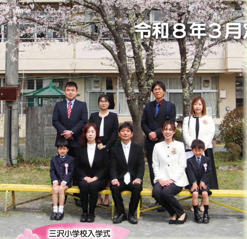
三沢小学校入学式