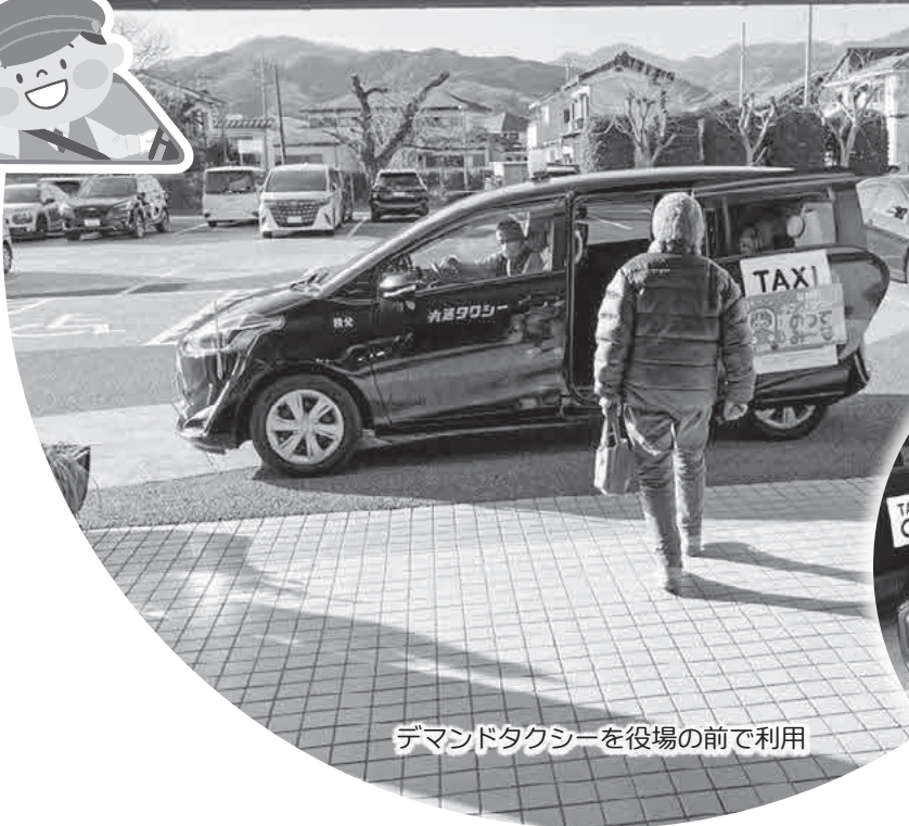
デマンドタクシーを役場の前で利用