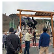
皆野スポーツ公園内の大行灯組立て作業