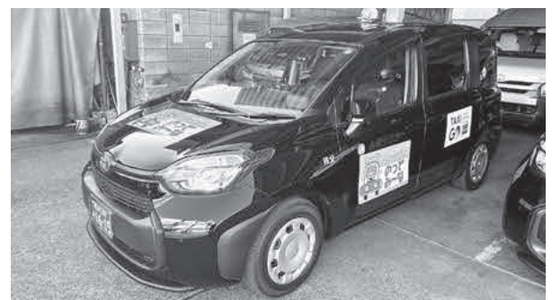
実証運行車デマンドタクシー「のってみ～な」

バス停まで歩くことが難しい方も増えており、既存の交通体系だけでは十分に対応できていません。こうした課題を踏まえ、乗り合いにより効率性を確保しつつ、一種免許の活用で担い手を広げることができるとデマンドタクシーが現時点で本町の実情に適した手法だと判断しています。将来にわたり唯一の手法とするものはありませんが、現段階での最適な方策として責任を持って取り組んでいきます。