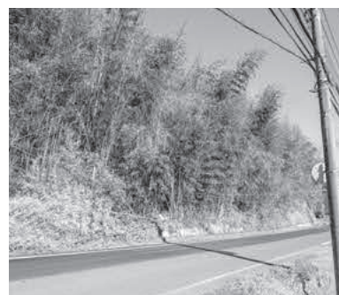
路面に架かる竹林

通りに進捗していますか。 答 産業観光課長 令和6年度は、譲与額以上の事業を実施しており不用額はありません。しかし、令和5年度までは実施事業に充当しきれず、基金に積立っています。 問 基金積立金を放置竹林の伐採補助・人家の危険木除去等の補助へ予算化する考えがありますか。 答 産業観光課長 危険木の除去は、個人向けの支援木の伐採補助、道路等のイ