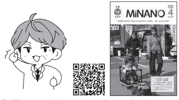
「町長コラム」広報みなの2026年4月号はこちらから

問 3年前、お出かけタクシーの規制緩和を提案した際は拙速とされましたが、その後2年間の検討と約1000万円の経費をかけて現在の「デマンドタクシー」に至りました。3か月間の