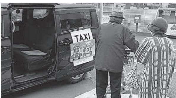
買物帰りでも店舗前で乗車できます

答 総務課長 活性化協議会の中で議論し、結論を出していきたいと考えています。 問 本格運行は、いつ頃ですか。 答 総務課長 本年秋頃の導入を考えています。 問 利用料金について伺います。 答 総務課長 料金は、300円から500円が適当ではないかと考えています。