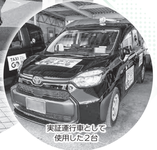
実証運行車として使用した2台