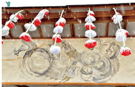
皆野スポーツ公園内の大行灯