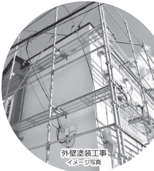
外壁塗装工事 イメージ写真