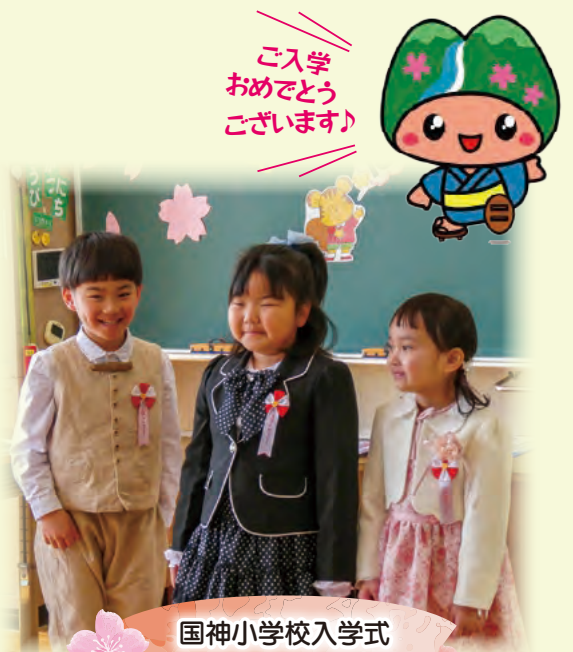
国神小学校入学式