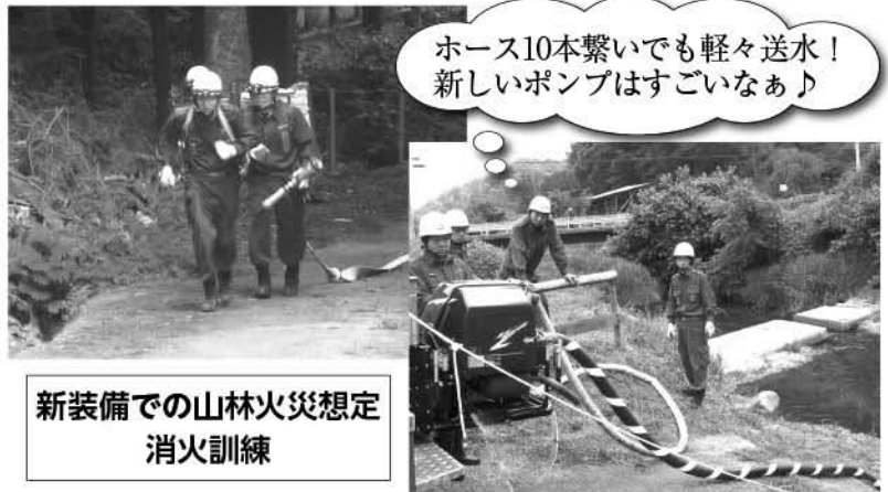
新装備での山林火災想定消火訓練

※火災や災害時には詰所から消防自動車が出動します。詰所の出入口には車などを停めないようにご協力ください。