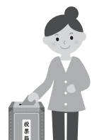
別表3 郵便などによる不在者投票ができるか