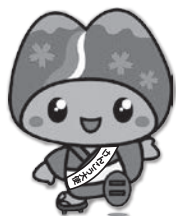
皆野町けんこう大使 み～な