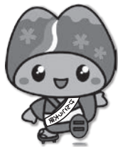
皆野町けんこう大使 み～な