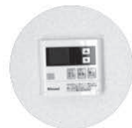
追い炊き機能付き

今回は大浜団地をご紹介しましたが、そのほかの町営住宅でも入居者募集をしています。家賃・申込み資格は左の枠内のおりですので、ぜひご検討ください!