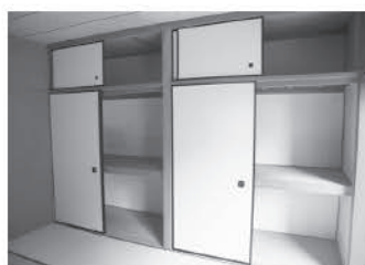
それぞれの部屋に収納スペース有