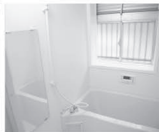
お風呂もリフォーム済み