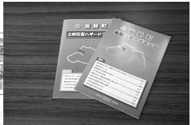
【ハザードマップ】 総務課で配付しています。

自然災害は突然やってきます。日頃から備えることが自分の身の安全確保につながります。町でも引き続き、防災行政に力を入れて取り組んでいきますので、ご協力をよろしく願います。