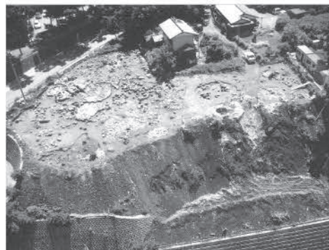
写真1 第7次調査 全景