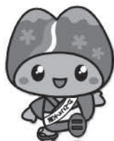
皆野町けんこう大使 み～な