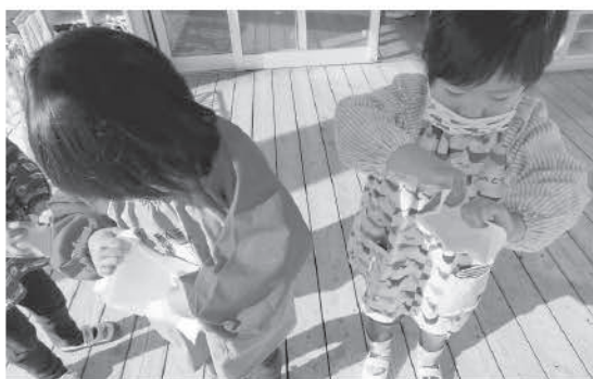
牛乳パックを開く年少児