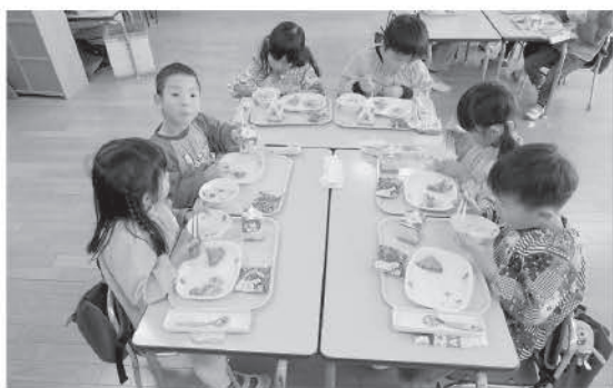
年長児の給食風景