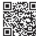
【また会いましょう】