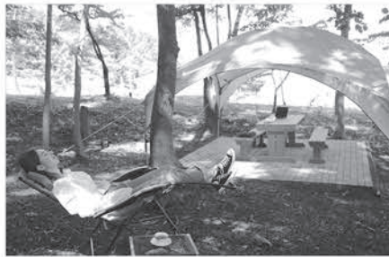
ヘリテージ美の山の「森のラウンジ」用 の宣伝写真。ゼレ隊員にモデルを頼んだ。