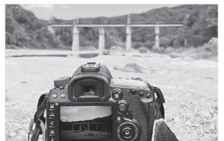
SL 撮影風景。町のPRに使えるような写 真は今後も撮影していきます!