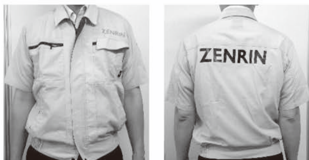
ゼンリンユニフォーム

調査員 株式会社ゼンリン ゼンリンのユニフォームを着用し、町発行の身分証明書を携行します。