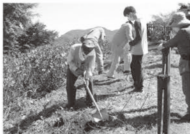
アジサイの 苗木の植栽

期 日 9月30日(土) ※雨天中止 時 間 午前10時～午後3時 場 所 美の山公園 定 員 20人(先着順) 参加費 大人 2,000円 子ども 1,000円 (昼食代含む) 申込み 9月22日(金)まで 観光協会(産業観光課⑧番窓口) ☎62-1462