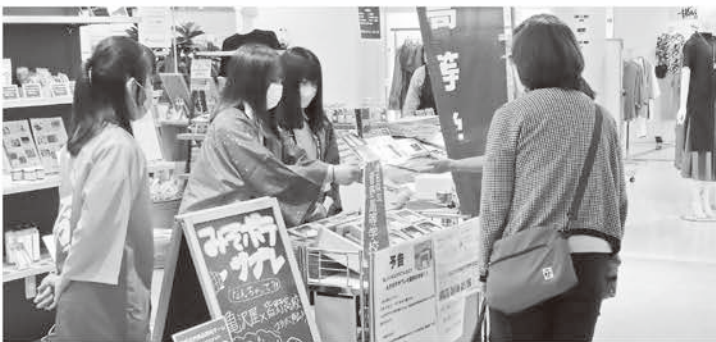
皆野高校生による販売実習

無事に終えた皆野長瀬フェア出店者との懇親会。慰労会だけにするにはもったいないと思い、この地域で積極的に活動や発信をしている何人かに声をかけてみると、数人が参加してくれました。その意見交換には、違う視点での地域の魅力の発見発信、空き家問題など、多岐に渡る意見交換は、外来種(私たち)だけでなく、在来種(地元出身の人)共通の危機感を持ち、それらの問題を意識しているのを知ることのできた集いでもありました。今後、より多くの人たちとよい皆野町を考えていきたいですね。