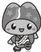
皆野町 けんこう大使 み～な