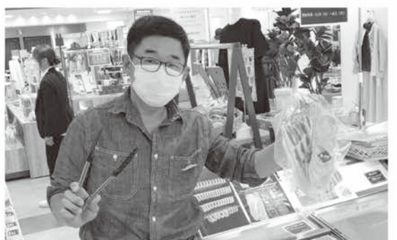
「塩とけむり」による試食販売

ツトは何度か補充が必要になるくらい、来場したかたにお持ちいただけました。また、常設埼玉ブースには、皆野町のパンフレットと並んで今後も置いていただけるといふことで、とてもありがたいですね。