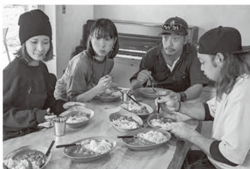
カフェメニューの試作中

「地域おこし」は簡単にできるものではない、というのが今の素直な気持ちです。中には変化をのぞまないかたも当然いらっしゃると思います。今のままでいい、静かに暮らしたい、そんなあたりまえの気持ちもあるのです。そんな地元のかたのさまざまな意見・気持ちを知らったうえで、「自分はこの町で何ができるのか？」と自問し続けることが大切なのだと学んだ3年間でした。