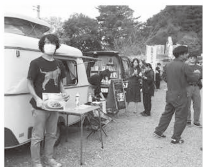
町内イベントへの参加

私はイワナが好きで、天然魚を求めて源流部まで、落葉樹の森を数時間歩き釣りをしますが、この地域固有の特徴、秩父イワナと呼ばれる赤味の強い個体は、現在は簡単に立ち入ることとはできない場所にしかいません。この「秩父イワナ」、乱獲により瀬戸際に立たされていますが、現在の進歩した養殖技術があれば、また元来の地域固有