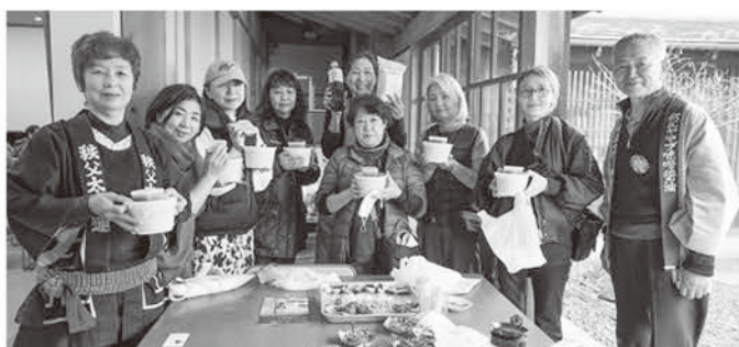
「ミナノミラノ」で開催したワークショップの参加者の皆さん