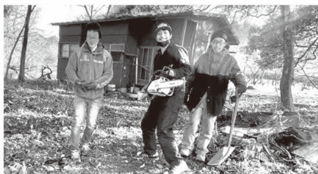
作業を手伝ってくれた皆さんと

キャンプ施設「僕らのミナノベース」計画が動き出した当初は、とにかく前途多難の様相でした。まだ僕自身に信頼が全くなかったこともあり、思いもよらぬ言葉を投げかけられることもあり、一時は全く自信を喪失し思い悩んだ時期もありました。しかしそんな中でも明るく優しく励ましていただいた近隣のかた、移住当初から相談に乗ってくださっていた地元のかた、役場担当者のかたなどの協力に支えられ、何とか開業することができました。