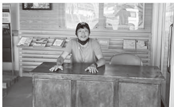
移住相談センターにて