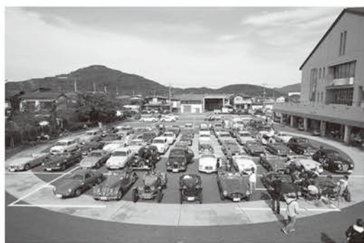
クラシックカーイベントの様子

また、ラリーイベントでは前日から宿泊されるかたも多く、地元宿泊施設での懇親会を行うほか、イベントの食事、コース途中でのゲームのために、お買い物競争、景品購入といったことも地域経済にも少しだけ貢献できたかと思っています。