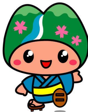
皆野町イメージキャラクター「み～な」