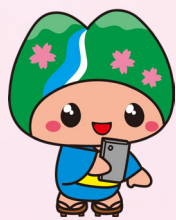
埼玉県秩父郡皆野町 イメージキャラクター「み～な」